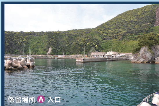
係留場所 A 入口