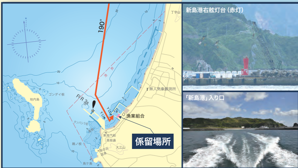
新島右舷灯台(赤灯)