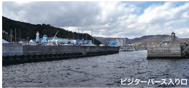
ビジターバース入り口