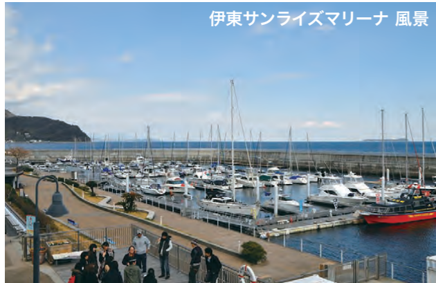
伊東サンライズマリーナ 風景

! 記載されている航路は、船舶免許1級の行き方です。 2級の方は直線コースで行くことが出来ませんが、1級へステップアップすれば熱海まで直線で行けるようになります。