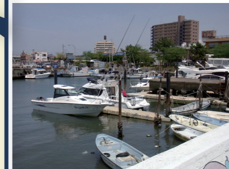
係留場所風景 (①に係留)